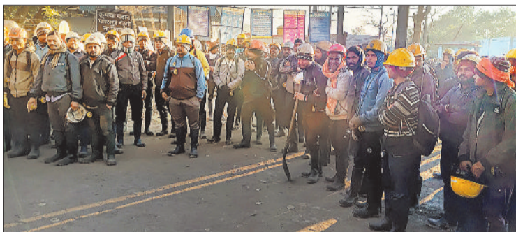
कर्मचारियों के साथ विरोध प्रदर्शन करते श्रमिक नेता।

जिसकी संपूर्ण जिम्मेदारी प्रबंधन की होगी। ज्ञापन में कहा गया है कि कर्मचारियों को 2 तारीख तक वेतन मिल जाना चाहिए, लेकिन हर महीने भुगतान में देरी की जा रही है। इसके कारण कर्मचारियों का आजीविका संचालन प्रभावित हो रहा है और परिवार आर्थिक संकट से गुजर रहे हैं। यूनिन ने मांग की कि वेतन भुगतान सुनिश्चित समय-सीमा में अनिवार्य रूप से कराया जाए। यूनिन ने ज्ञापन में मिलने से कर्मचारियों में गहरा आक्रोश है और प्रबंधक द्वारा कथित रूप से अनाधिकृत निर्माण के आरोप में परेशान किए जाने का भी