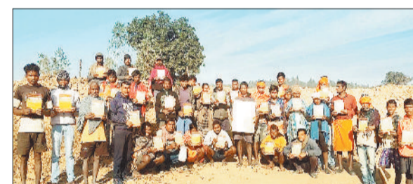
आधारित हो रही हैं। मनरेगा प्रावधानों के अनुसार प्रत्येक ग्राम पंचायत में प्रतिमाह 7 तारीख को रोजगार दिवस मनाया जाता है। इस दिन श्रमिकों से संवाद, जानकारी साझा करना तथा योजना संबंधी सुविधाएं उपलब्ध कराई जाती हैं।