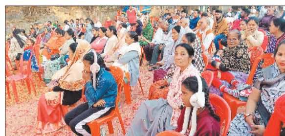
कार्यक्रम में उपस्थित लोग।

में उपस्थित रहे। सम्मेलन में अपने उद्घोषण के दौरान श्री सिदार ने कहा कि हिंदुत्व केवल आस्था नहीं, बल्कि भारत की सांस्कृतिक पहचान है। राष्ट्र का आधार हमारी परंपराएं, मूल्य और सनातन विचारधारा रही है। आज समय है